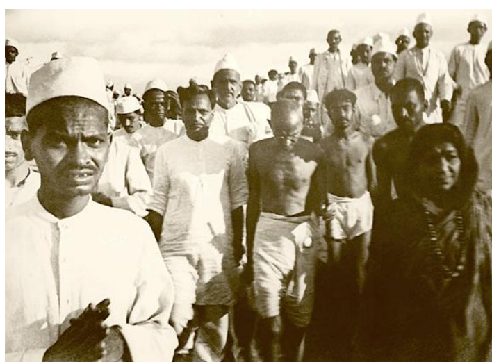
Соляной марш, организованный Ганди во время сатьяграхи 1930 г.