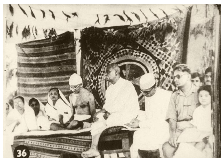
М. Ганди в Бардоли во время объявления сатьяграхи 1928 г.

заслуженный авторитет среди стран «третьего мира» и статус основателя и лидера Движения неприсоединения. И хотя потенциала индуистско-гандийской идеологии было недостаточно для полного разрешения («снятия») всех социальных конфликтов общественной жизни, именно благодаря ставшим основой «единства в многообразии» цивилизационным факторам, самому М. Ганди и гандизму даже в условиях непрекращающихся претензий штатов к центру в вопросе о децентрализации управления и соответствующего перераспределения полномочий, страна избежала (и избегает) возможных конфликтов на почве регионального сепаратизма. Сказалось также и то, что в регионах, все более втягивающихся в общенациональное разделение труда, начали формироваться социальные слои, заинтересованные в государственном единстве и общественной стабильности.