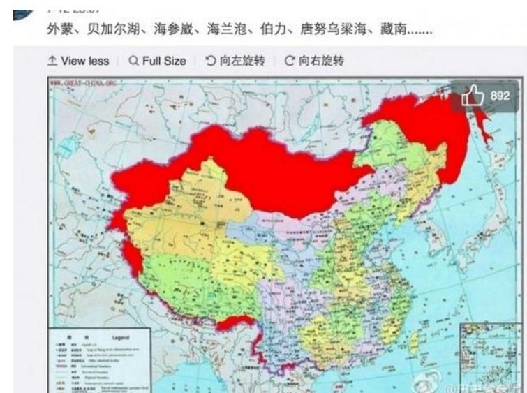
Карта Китая, опубликованная китайским блогером. Красным отмечены «утраченные китайские территории», 2000-е гг.

В целом стратегический потенциал и специфика участия государств Востока в глобальном противоборстве определяются: