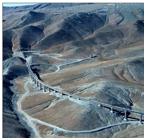
Цинхай-Тибетская железная дорога, 2000-е гг.