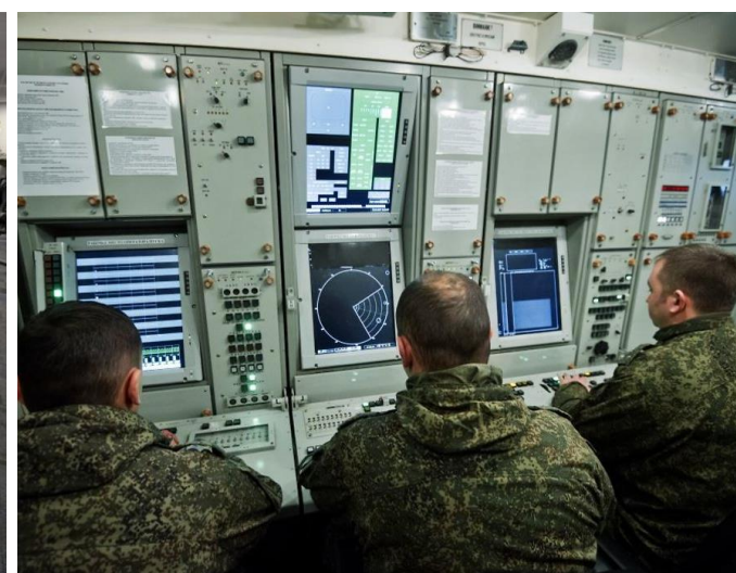
Кибервойска Китая (слева) и США (справа).