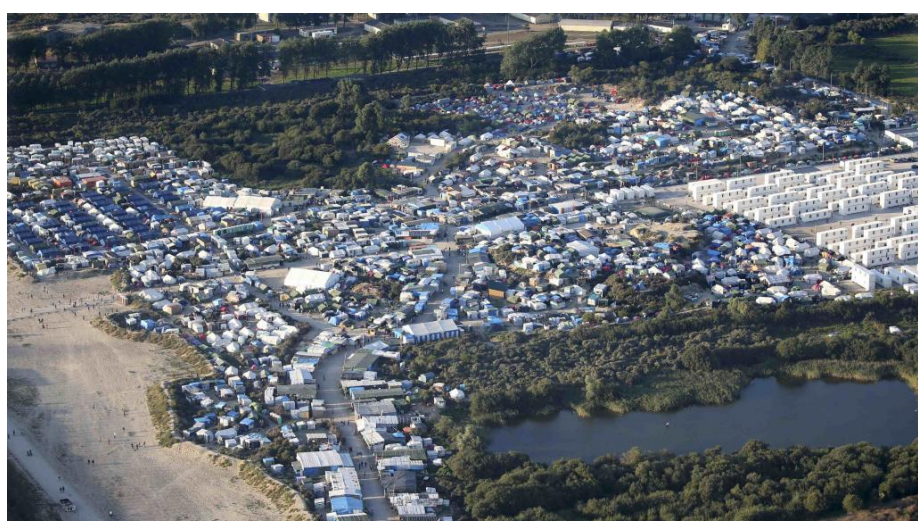
Вид сверху на лагерь беженцев «Джунгли» в Кале, Франция, накануне демонтажа.

В начале XXI в. терроризм и экстремизм начинают использоваться США в качестве геэкономического оружия в ходе дестабилизации Ближнего Востока с целью ослабления таких глобальных конкурентов, как ЕС (в результате спровоцированного много-миллионного потока мигрантов), Китай, Индия (в итоге создания военно-политических барьеров, преграждающих доступ к энергетическим ресурсам, необходимых для поддержания высоких экономических темпов развития, а также торговые войны).