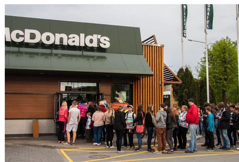
Очереди в первые Макдональдсы: слева — в Москве (1990), справа — в Астане (2016).