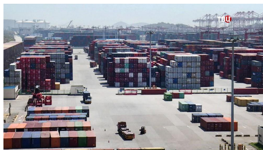
Контейнеры в порту КНР в период торговой войны между США и Китаем.